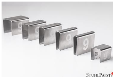
HAR.MONIE Nummerierung Klemme Klein